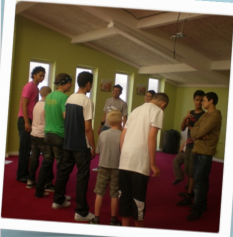
Organizamos brincadeiras e também atividades para os jovens não-cristãos do bairro